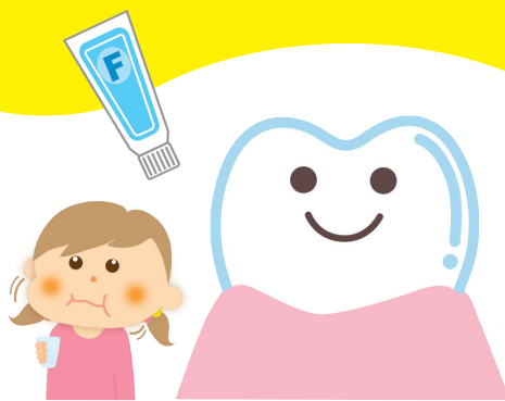
フッ素塗布やフッ素洗口、フッ素入り歯みがき剤で 歯を強くし、むし歯から歯を守る

毎日の仕上げみがき時にフッ素入り歯みがき剤等を使用すると、使用しない場合に比べ、有意にむし歯になりにくいことがわかっています。(親子で歯っぴ〜プロジェクト事業報告書)