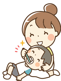
大人による仕上げみがき 寝かせみがき・立たせみがき・後ろ立たせみがき

むし歯予防には「小学4年生頃までの大人による仕上げみがき」と「フッ素の利用」が効果的です。